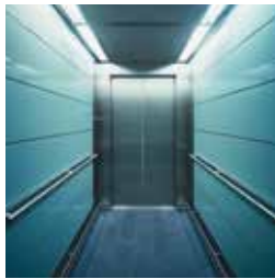
Innenverkleidung von Aufzügen